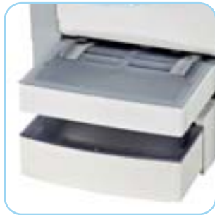
Bac supplémentaire en option