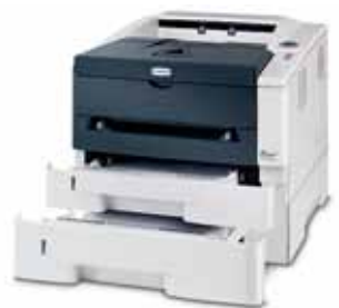
Bac papier PF-100

Le produit représenté est doté d'options supplémentaires.