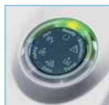
Panneau de commande LED, facilitant sa gestion.

Résolution de 1.200 dpi, garantissant des textes très nets et des graphiques très précis.